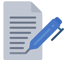
Epreuve écrite 2h Réflexion sur un sujet ayant trait au métier d'éducateur.trice sportif.ve