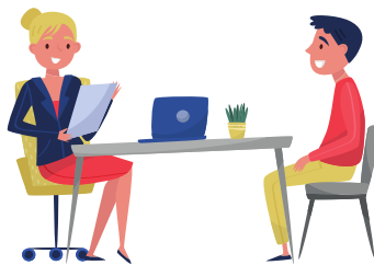
Entretien de motivation 20min