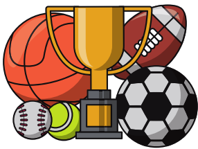
Pratique sportive collective 1h

Ces épreuves sont spécifiques à chaque organisme de formation. Elles se font de manière conforme au dossier d'habilitation validé par la DRAJES Bretagne. Seul.e.s les candidat.e.s ayant validé les épreuves de TEP pourront se présenter aux épreuves de sélections.